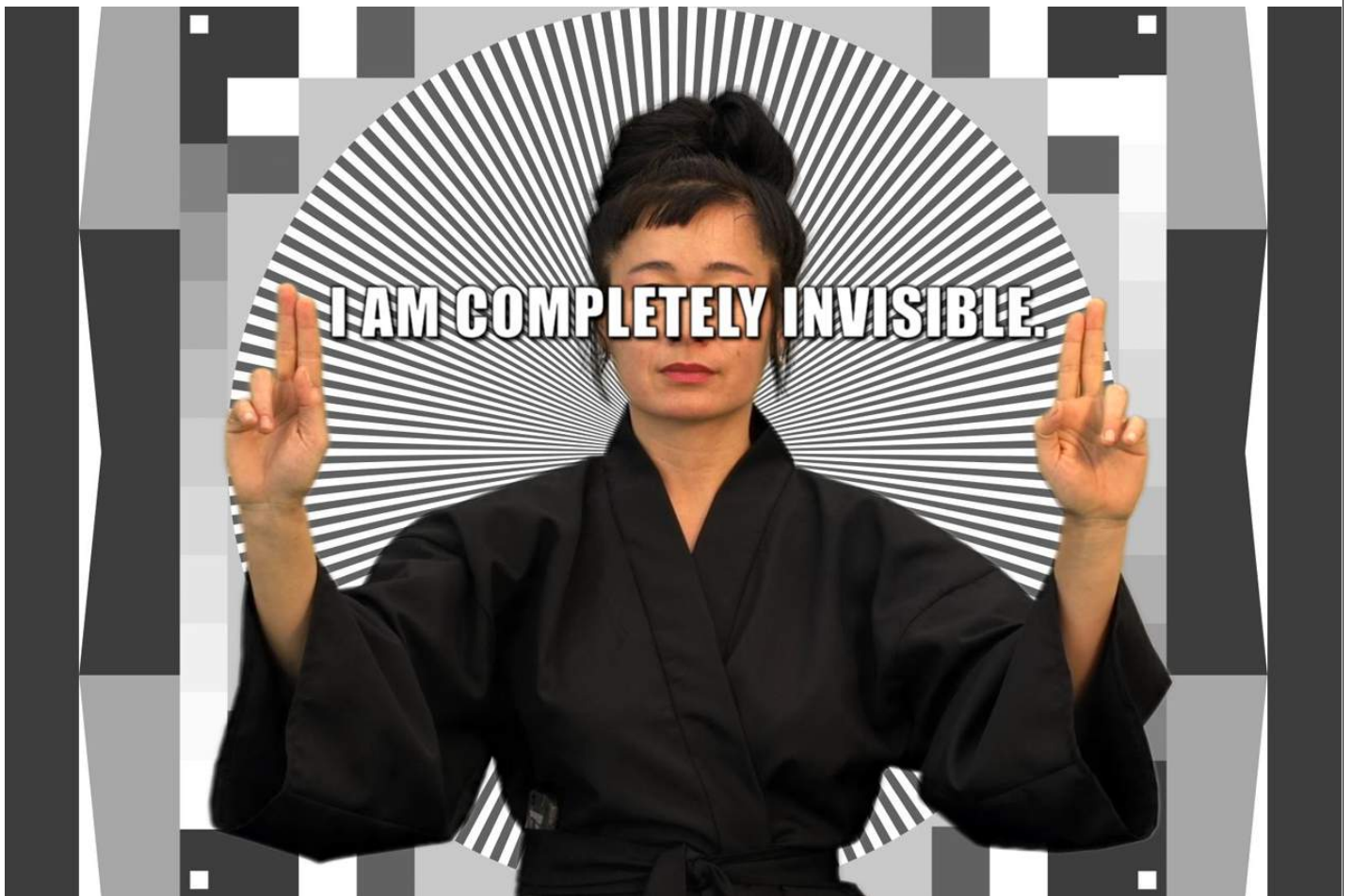
Hito Steyerl, How Not to Be Seen: A Fucking Didactic Educational .Mov File , 2013, © Hito Steyerl, courtesy Wilfried Lentz Rotterdam

Il video, che sarà visibile a Le Murate per tutti i giorni del festival, documenta l'impatto che il progetto di architettura residenziale Dom-Ino pubblicato nel 1914 da Le Corbusier ha avuto sul territorio italiano: dal boom del dopoguerra all'ambiziosa architettura residenziale popolare degli anni Settanta, fino alla crescita delle società immobiliari private degli anni Ottanta; Marine Hugonnier con il suo Apicula Enigma , poetico film nel quale l'artista francese, affascinata dal magico mondo delle api e della loro micro-utopica comunità di lavoro, cerca di mostrare come le immagini della natura possano venire rappresentate quali vere e proprie storie.