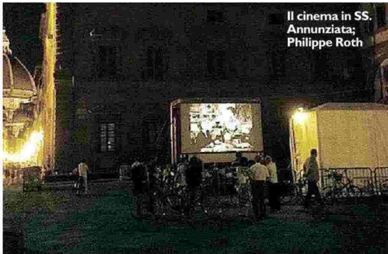
Il cinema in SS. Annunziata; Philippe Roth