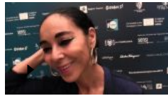
Shirin Neshat: essere un'artista è un viaggio nell'ignoto