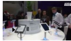
Dieci anni del Kindle, rivoluzione lettura