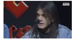
Addio Malcolm Young, anima degli Ac/Dc