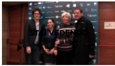
Il cinema e il contemporaneo: due mondi e lo Schermo dell'arte