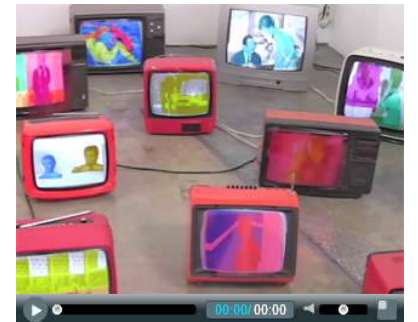
Da Torino un viaggio per immagini tra Artissima e la mostra Shit & Die