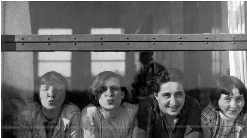
Weberinnen am Fenster