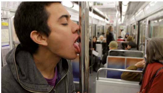
Iván Argote, Altruism , 2011.

VISIO-European Programme on Artists' Moving Images è un progetto di ricerca e residenza dedicato ad artisti che utilizzano le immagini in movimento nella loro pratica artistica.